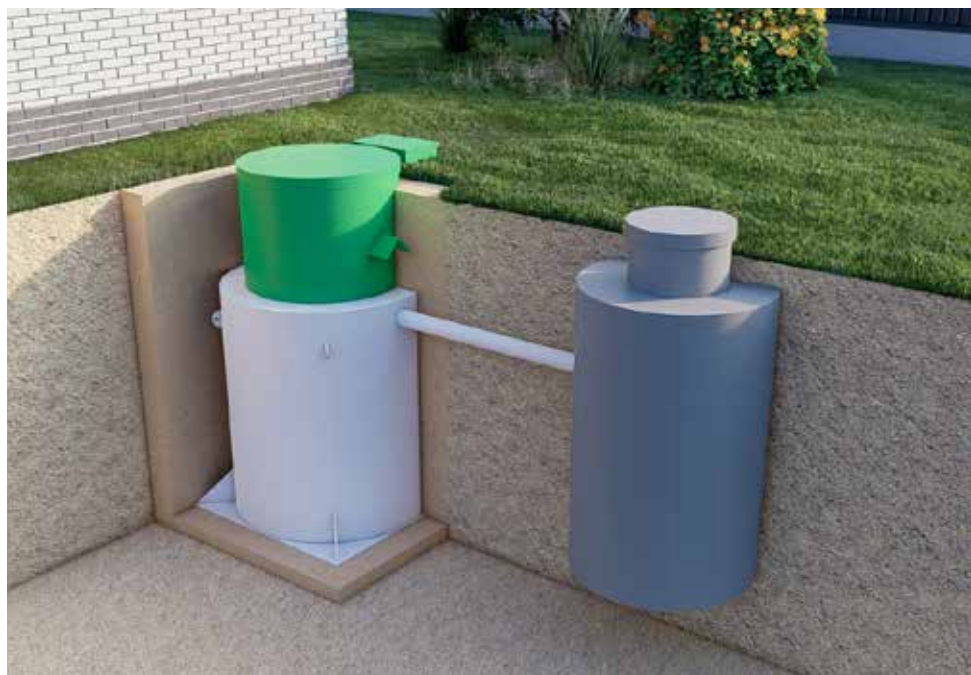
1. Самотеком в колодец фильтрующий/накопительный или глубокую канаву/овраг

Варианты отвода очищенной воды зависят от условий на участке и фильтрующей способности грунта: